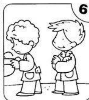
ESPERO MI TURNO