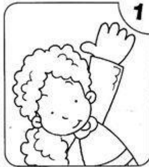
LEVANTO LA MANO PARA HABLAR