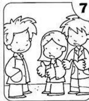
ESCUCHO A MIS COMPAÑEROS Y COMPAÑERAS