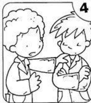
PIDO DISCULPAS SI ME EQUIVOCO