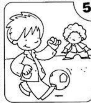
JUEGO CON TODOS MIS COMPAÑEROS Y COMPAÑERAS