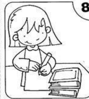
TRABAJO EN EL AULA