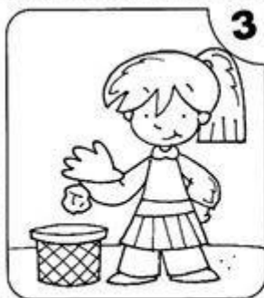
NO TIRO PAPELES AL SUELO